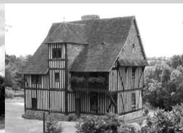
Les lauréats 2011, 2010 et 2009

Envoyer votre candidature ou une simple demande de dossier à Michèle Bertrand Durtis, poste restante 14430 Dozulé avant le 4 juin 2012