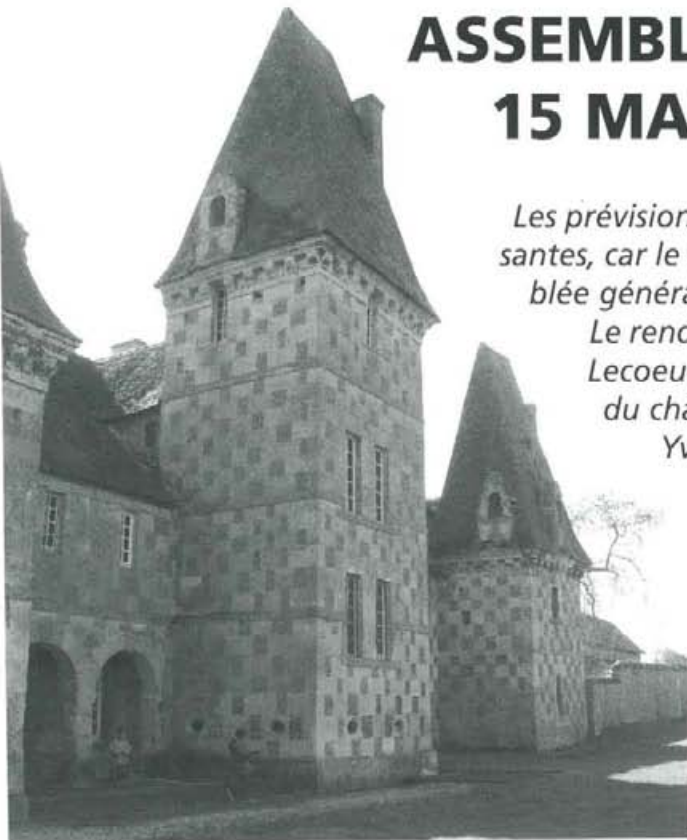
Le château de Cricqueville, facade nord.

Yves Lescroart nous présenta ensuite l'architecture de cette demeure.