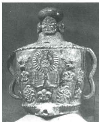
Fontaine de Manerbe en terre cuite du Pré d'Auge signée Vincent. Coll. Musée de Lisieux.