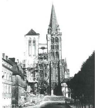
A. Humbert de Molard, Cathédrale de Lisieux en cours de restauration.