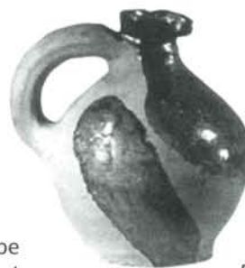
Pichet, Coll. Musée de Lisieux

Le Pays d'Auge, toujours, a été évoqué lors de l'exposition Un temps d'exubérance, les arts décoratifs sous Louis XIII et Anne d'Autriche qui s'est tenue dans les Galeries nationales du Grand Palais à Paris, du 9 avril au 8 juillet 2002.