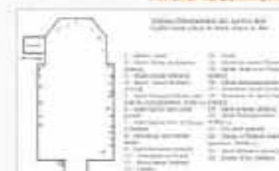
Schéma d'implantation des œuvres dans l'église Saint-Ouen de Saint-Ouen-le-Pin