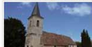
église saint ouen de Saint-Ouen-le-pin