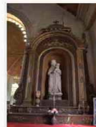
Vierge de l'autel sud

Après validation l'article est en ligne sur le site avec toutes les illustrations